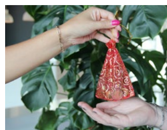
7 Tips inzake de btw