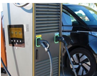
5 Tips voor de automobilist