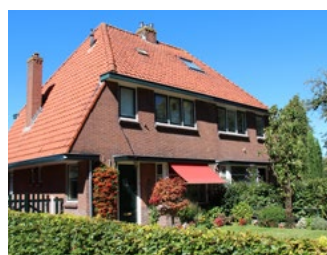
6 Tips voor de woningeigenaar