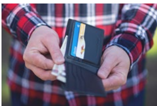
1 Varia loon- en premieheffing

Tevens bevat deze editie informatie over bijvoorbeeld de auto van de zaak, de thuiswerkvergoeding, de WKR en de transitievergoeding.