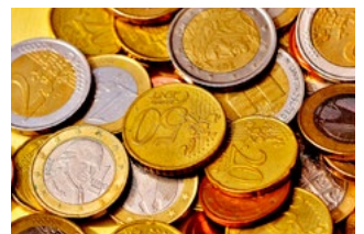
4 Wet tegemoetkomingen loondomein